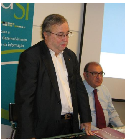
Apresentação da 16ª Tomada de Posição do GAN da APDSI

O GAN é composto por um pequeno número de membros selecionados individualmente pela direção da APDSI, colocando o seu conhecimento e experiência ao serviço da comunidade nacional. O GAN tem a missão de facultar à Direção da Associação para a Promoção e Desenvolvimento da Sociedade da Informação, de forma sistemática e continuada, uma avaliação qualitativa e quantitativa da ação dos Órgãos de Soberania e de outras iniciativas relevantes na área da Sociedade da Informação e do Conhecimento.