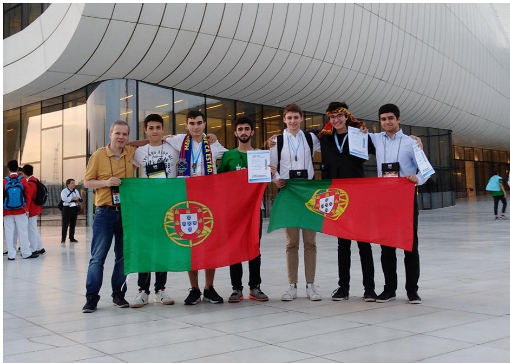
A delegação portuguesa junto ao auditório onde ocorreu a cerimónia de encerramento em Baku, no Azerbaijão.

De 4 a 10 de agosto, a cidade de Baku, no Azerbaijão, recebeu a 31ª edição das Olimpíadas Internacionais de Informática (IOI), onde 329 alunos de escolas secundárias provenientes de 87 diferentes países ou regiões demonstraram o seu talento na programação.