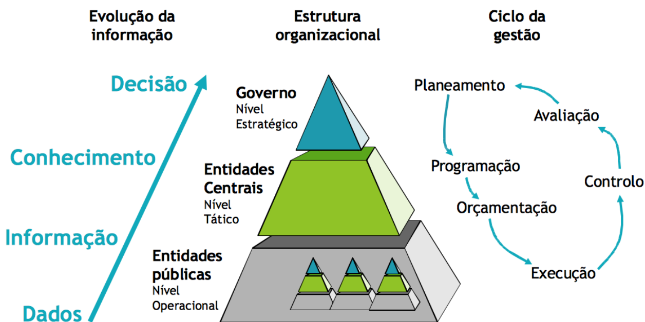
Figura 2 - Relação da informação com o ciclo de gestão da Administração Pública

Para gerir, para além de ter dados sobre a realidade em relação à qual se atua, é necessário também ter objetivos que orientem as escolhas. A gestão é a ação que transforma a realidade atual na que pretendemos atingir. Neste caminho é necessário ter dados que suportem as diferentes fases do ciclo da gestão (ver figura 2).